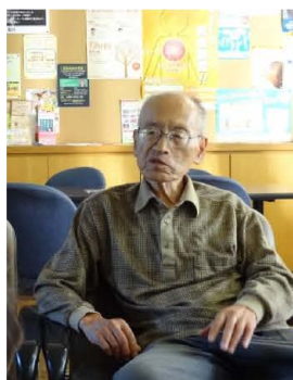
大学時代はバイオリンを習っていたほどクラシック音楽好き。「G線上のアリアを聴きながらおいしい赤ワイン飲んだら最高だな」さすが元酒屋の店主。

当時、商店街には同業種である酒屋が3軒。仲間とはいえライバル。商店街も全盛期で、夜は12時頃まで店を開けていた。相当な忙しさだった。