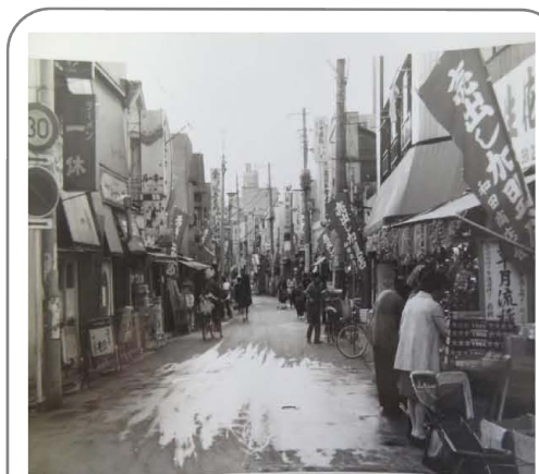
周りに高い建物もなく、まさに「あおぞら」が一面に広がっていた当時